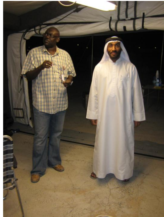
Vertegenwoordigers van Dubai Police

Om ongeveer 19.30 uur is de oefening weer gestart. Voor vanavond en morgenochtend staan dezelfde oefeningen op het programma, waarbij men nu een ander onderdeel voor zijn rekeningen neemt.