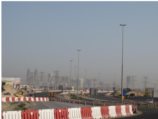
Dubai, een imposante bouwput