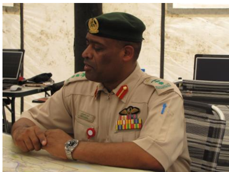
Col. Anas al Matrooshi

Ook het team van TNO gaat na ruim twee weken terug naar Nederland om de verzamelde data te verwerken.