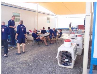
Op de plaats rust

Donderdagochtend stonden we om 08.15 uur weer op het sportveld. Na een uur allerlei oefeningen uitgevoerd te hebben, was de groep hard toe aan wat schaduw en water. De temperatuur was om 09.30 uur inmiddels al opgelopen tot 39 graden Celsius. Door de warme landwind liep de temperatuur verder op.